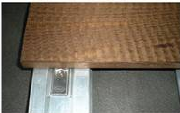
auf SIGHGA® SymbioFix