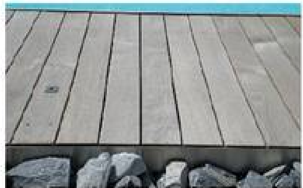
... mit Revisionsöffnung